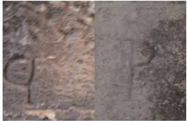
Fig. 7. Marca de N especlar en los puentes de Barbadillo del Mercado(arriba) y Talamanca (abajo). Río Arlanza. A la derecha, fig. 8. Marca "p" especlar en Salas de los Infantes (Burgos) (izqda) y Marca "p" en Bárcena Mayor (Cantabria) (dcha).

La distancia entre los dos puentes es de aproximadamente 90 km.