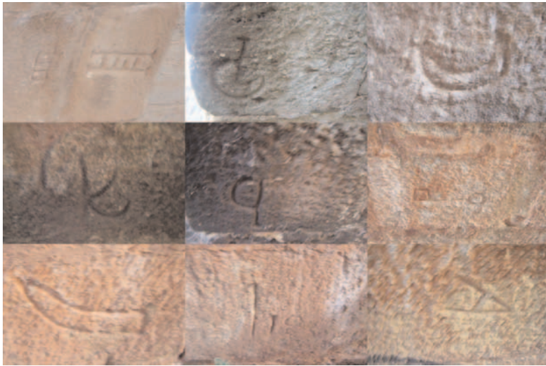
Fig. 4. Marcas en Puente Costana. Salas de los Infantes (Burgos).

rioidad es que algunos símbolos se repiten con mucha frecuencia (N, N espejular, X, L, ...) de unas obras a otras y sin embargo otros solo se han observado en una única construcción (luna, escalera, ...). Entre los que se repiten los hay de los que lo hacen de forma exacta (N, o N espejular) y otros con ligeras variaciones que claramente no son casuales, sino intencionadas (llave, p, ...).