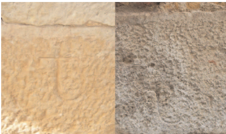
Fig. 9. Puente de Tordómar (río Arlanza, Burgos) (izqda) y Puente en Salamanca (dcha).

el puente de Tordómar (Burgos) sobre el río Arlanza, y el puente de Salamanca sobre el río Tormes. El origen del puente de Tordómar es claramente romano, sin embargo, los arcos sobre los que existen las marcas, son los situados más hacia la margen izquierda, y probablemente medievales, aunque por similitudes con el de Salamanca, es posible que puedan ser incluso ligeramente posteriores. La forma de la marca es prácticamente análoga. La distancia entre ambos puentes es de aproximadamente 200 km.