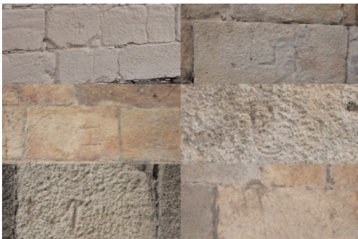
Fig. 5. Puente renacentista en Salamanca. (L, l, t, T tau, h invertida, cruz griega y cruz latina). A la derecha, fig. 6. Marca "llave" en puentes de Salas de los Infantes. (Burgos) (izqda.) y Salamanca (dcha.).

En los dos puentes a que nos referimos en la figura 7 se observa la misma marca, la que hemos denominado "N espejular". Ambos puentes se encuentran en el río Arlanza (Burgos), siendo uno de ellos el de Barbadillo del Mercado, y el segundo el que es conocido como de Talamanca, en el término municipal de Villahoz. El primero de ellos presenta aspectos constructivos que nos permitirían datarlo hacia el siglo XIII, sin embargo el de Talamanca presentan dos zonas bien diferenciadas, que se corresponden a dos épocas totalmente diferentes. La más moderna es la situada más a su margen izquierda, y podría tener una datación análoga a la del Puente de Barbadillo del Mercado. Los sillares de ambas obras se encuentran muy bien trabajados.