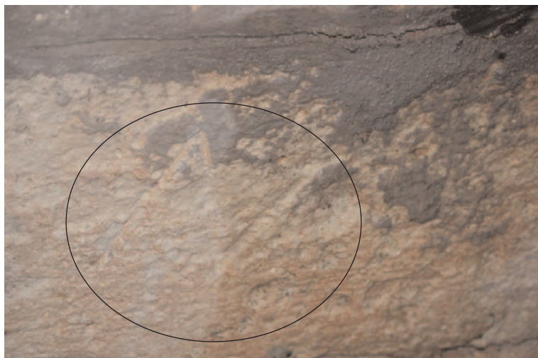
Fig. 2. Marca N en el puente de Puentedura (Burgos). Río Arlanza.

como son las catedrales. En las obras de ingeniería civil podríamos citar puentes y acueductos, pero centrándonos en los primeros. Tras esta primera, y sencilla clasificación, observamos que la mayor parte de los estudios realizados hasta la fecha sobre las marcas de cantero se refieren exclusivamente a los edificios religiosos.