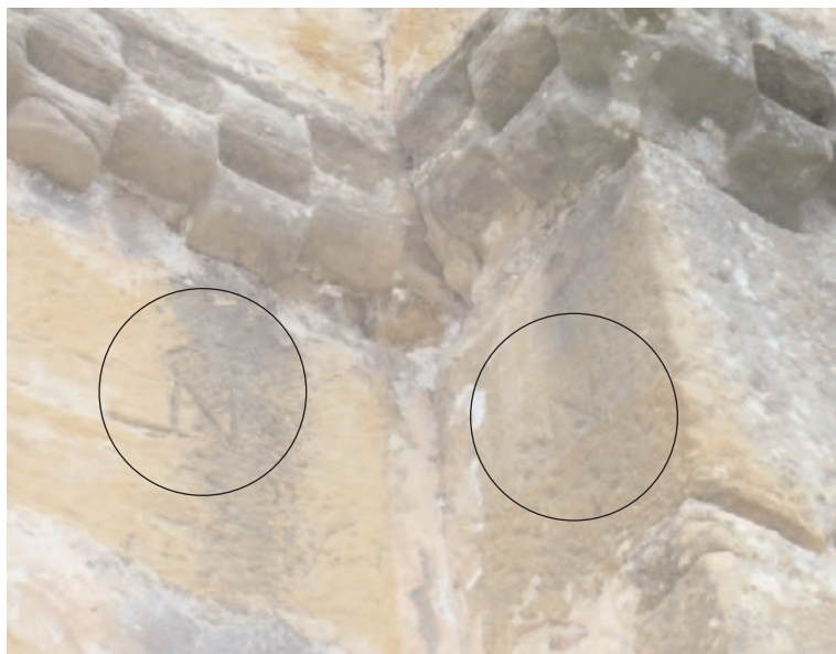
Fig. 1. Marca N en la Colegiata de Santillana del Mar (S. XII).

supone van asociadas a un oficio concreto, deberían de existir en cualquier tipo de construcción de piedra de esa época. Pero no es así. En unas existen y en otras no. En algunas existen en gran abundancia, y en otras apenas en algunos sillares. Para comenzar el enfoque, deberíamos de realizar una primera clasificación de las construcciones en piedra, dividiéndolas en tres grandes grupos: construcciones habitacionales, construcciones religiosas, y obras civiles como los puentes. Dentro de las primeras las construcciones dedicadas a vivir, se encontrarían desde las casas más sencillas realizadas, en piedra, los palacios, o los propios castillos medievales. Entre las construcciones religiosas, tendríamos los monasterios, conventos, iglesias, y las de mayor exponente