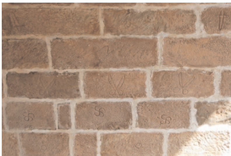
Fig. 3. Marcas de cantero en todas las hiladas de la bóveda. Salas de los Infantes (Burgos). Río Arlanza.

Para la localización de las marcas en los puentes nos tenemos que orientar hacia las bóvedas, y en concreto hacia su intradós. En los tímpanos no se suelen localizar marcas de cantero, y en las boquillas de las bóvedas tampoco. Sobre su posible existencia en el trasdós de las bóvedas, sería un factor a investigar, pero raramente se tiene la oportunidad de acceder a esa parte de la fábrica, y en las po-