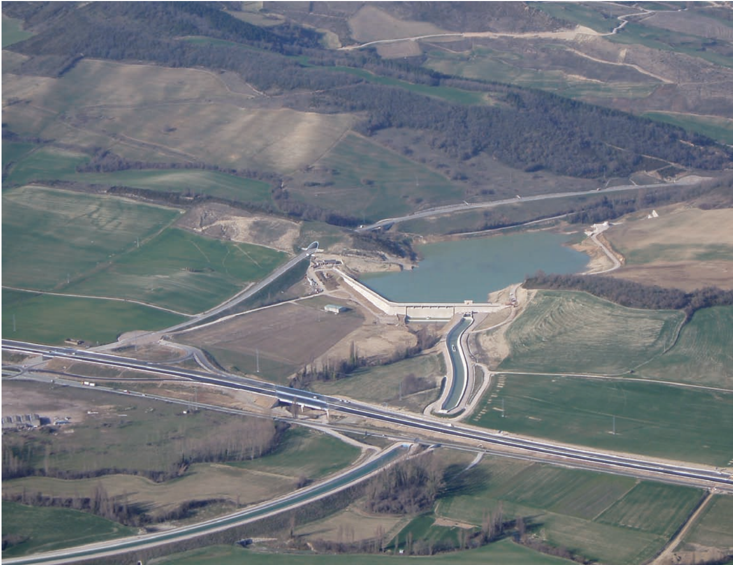
Presa de Monreal y Tramo3.

La altura máxima de vertido es de 1,10 m para un caudal punta de avenidas de 137 \text{ m}^3/\text{s} producido por un aguacero de 96 horas de duración y 500 años de período de retorno.