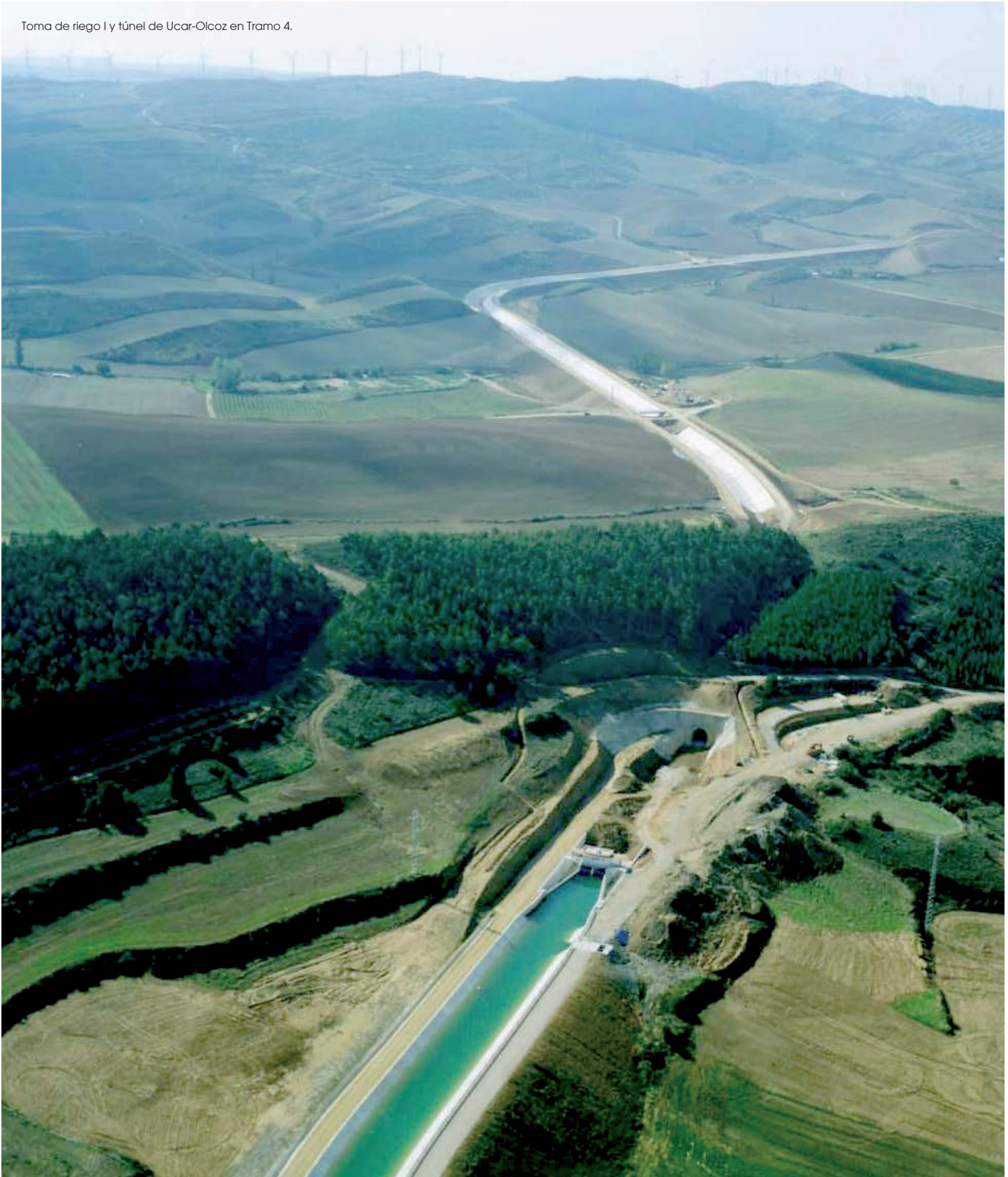
Toma de riego I y túnel de Ucar-Olcoz en Tramo 4.