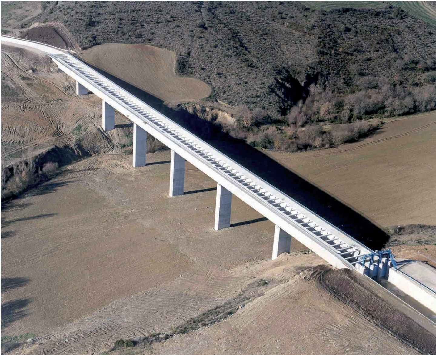
Acueducto de Gurpegui.

dan las demandas en cada toma del canal de modo automático. Existen otras estructuras, como las de acceso al canal, drenajes, pasos específicos para fauna o las de cruce que permiten dar continuidad a las vías de comunicación y otros servicios afectados por el canal. A ambos lados de la caja del canal y en paralelo con él discurren dos caminos de servicio de 7 y 5 m de anchura.