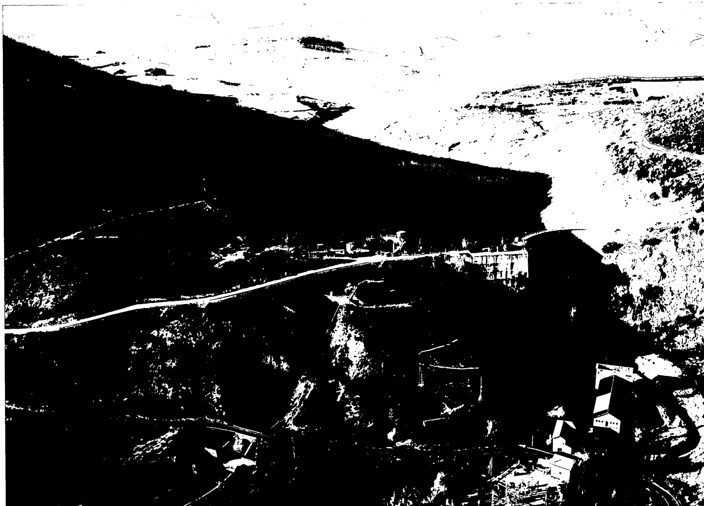
Fotografía 1. Vista general de la presa, el vaso y el canal de descarga del aliviadero, situado en la margen derecha. También se observa la central hidroeléctrica a pie de presa.

los datos más destacables es que la cuenca que alimenta principalmente al río Salado es una sierra (la de Andía) de naturaleza calcárea, muy fisurada lo que origina gran cantidad de fuentes. Como puede comprenderse, las calizas fisuradas son un lugar excepcionalmente malo para emplazar un embalse, sobre todo si están carstificadas, debido a las grandes filtraciones que sufrirán. Dice Esteban Errandonea que el río Salado es de carácter torrencial como todos los afluentes del Ebro, no obstante dicha afirmación no es del todo rigurosa debido a su poca precisión y generalización. Más bien es el carácter irregular en las aportaciones de algunos ríos de cabecera de la cuenca del Ebro, entre los que puede incluirse el Salado, el que aconseja su regulación.