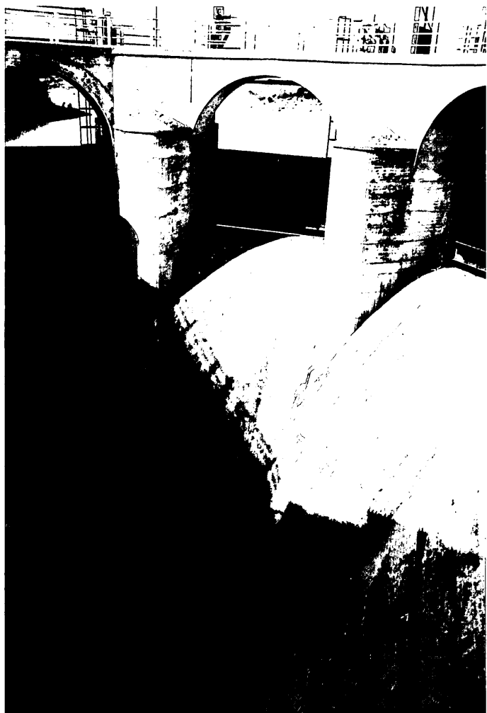
Fotografía 5. Vista de las compuertas del aliviadero.