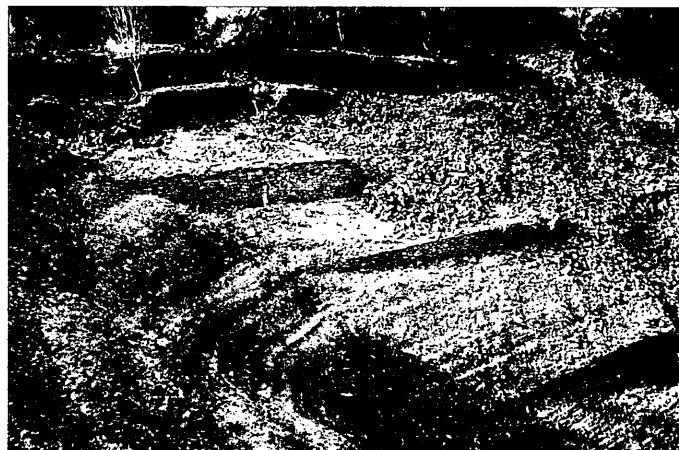
Fotografía 3. Muros de fábrica para reforzar los yesos de la margen derecha.

En Alloz, para determinar el coeficiente de escorrentía se estudió la relación entre lluvias y caudales en el río Arga, que se consideró hidrológicamente afín. El coeficiente de escorrentía resultó ser mayor de 0,7 lo que parecía indicar una alta permeabilidad de la cuenca debido a esas calizas fisuradas que podían provocar una interconexión con cuencas vecinas, siendo por lo tanto la cuenca receptora real mayor que la topográfica, extremo que parecía ser confirmado por la existencia de diversas fuentes. A partir de los datos disponibles de caudales medios obtuvieron los caudales de avenida para los cuales se diseñó el aliviadero. Este aliviadero, según Florentino Santos, fue modelo para España y para el resto del mundo durante muchos años.