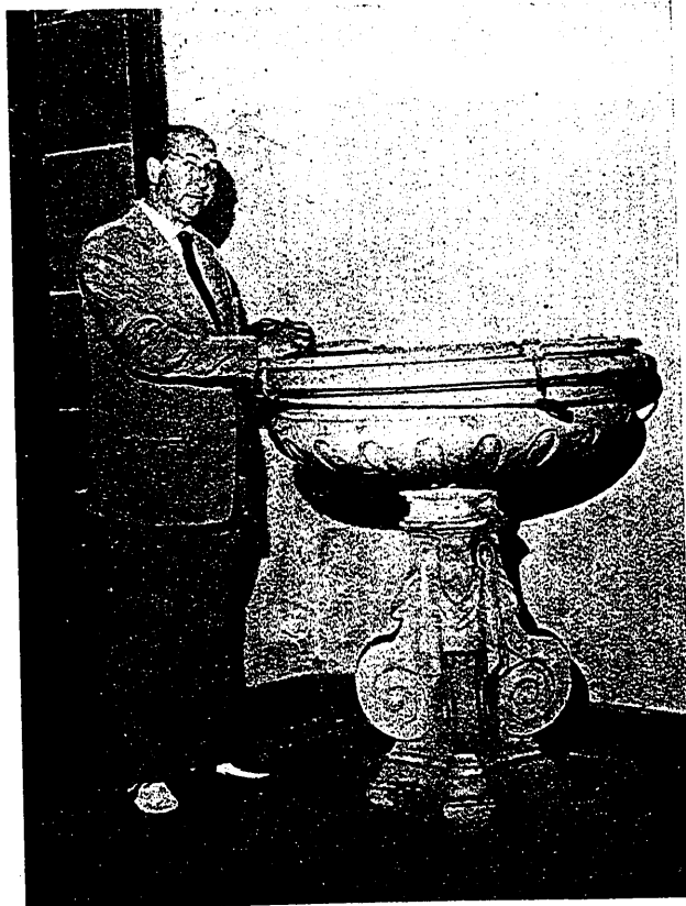
Fig. 3. a — Pila bautismal de D. Agustín de Betancourt en la Parroquia de Ntra. Sra. de la Peña de Francia.

telación canaria de trece estrellas isleñas — la cursilada no es manca — que escribió en 1800. Claro que Viera no vive continuamente la vida de Tenerife, pues vive en La Orotava hasta los veintiséis años (uno antes de nacer Agustín), en que pasa a La Laguna, yéndose a la península en 1770 (a donde llega