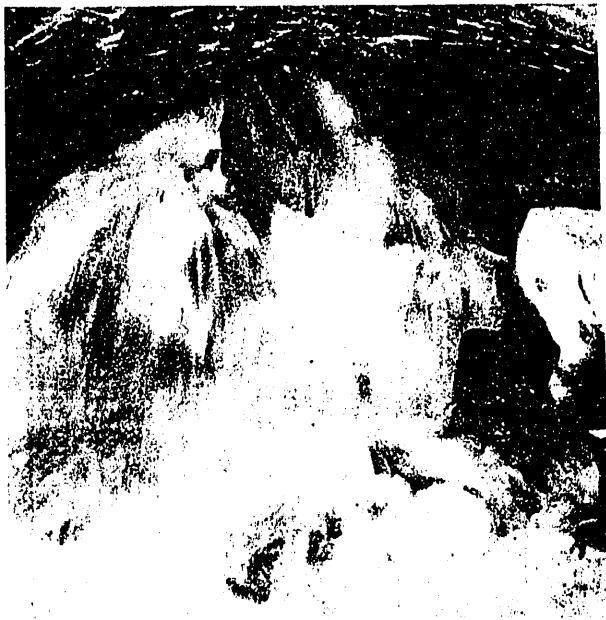
Foto 6.ª — Vía de agua de 300 litros/seg., durante la construcción del túnel de desagüe.

El socaz discurre, en planta, casi paralelo al río y por debajo del nivel del mismo en cuatro alineaciones, con amplias curvas y longitud de 3 104 m. Está excavado en gran variedad de terrenos: calizas de variable dureza y coloración, arcillas y yesos, habiendo sido necesario el revestimiento en algunos tramos. Fue atacado por seis ventanas o galerías: cuatro de ellas, perpendiculares a su eje, y las otras dos, por la chimenea de equilibrio y por su desembocadura.