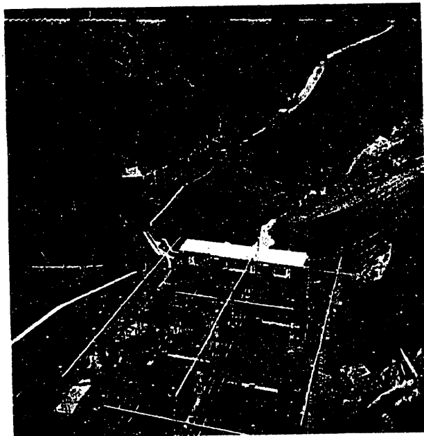
Foto 5. a — Conjunto de la estación transformadora y carretera de acceso, vista desde la coronación de la presa.

ño, está formado por una turbina, también Francis, de 11 300 HP., para 10 m. 3 /seg., con alternador de 10 000 KVA. a 500 r.p.m. y la misma tensión de salida.