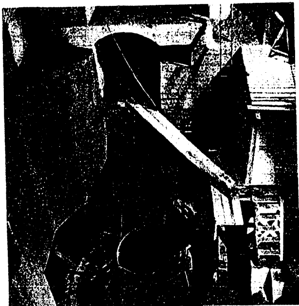
Foto 4. a — Montaje del forro del tubo de aspiración de uno de los grupos.

Consta la central de tres grupos, formados por turbinas Francis de K.M.W. y alternadores ASEA, ambas casas suecas. El primero y tercer grupos lo forman turbinas de 22 700 HP., con alternadores de 20 000 KVA. a 375 r.p.m., y 13 800 V., con un caudal de 20 m. 3 /seg. El segundo grupo, más peque-