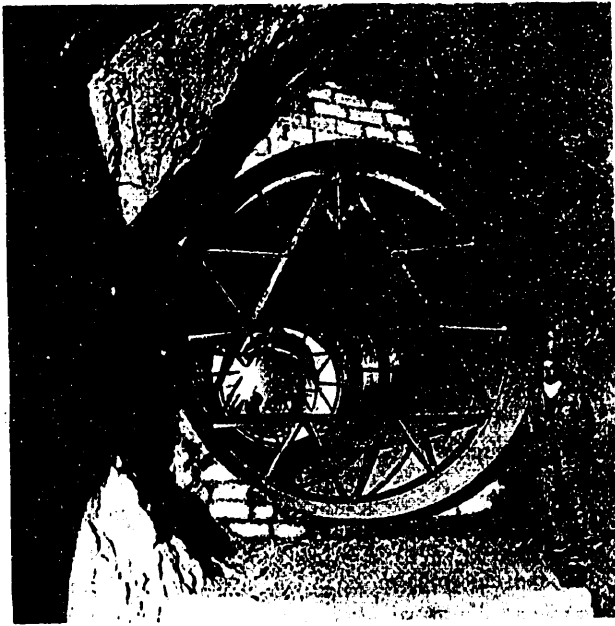
Foto 2.ª — El blindaje de la conducción forzada queda instalado y hormigonado entre el embalse y la cámara de llaves.

Se han empleado 230 000 m. 3 de hormigón, usando sand-cement como aglomerante. Sus dosificaciones han variado entre 200 y 325 Kg./m. 3 . Tiene juntas de contracción espaciadas 15 y 22 m.